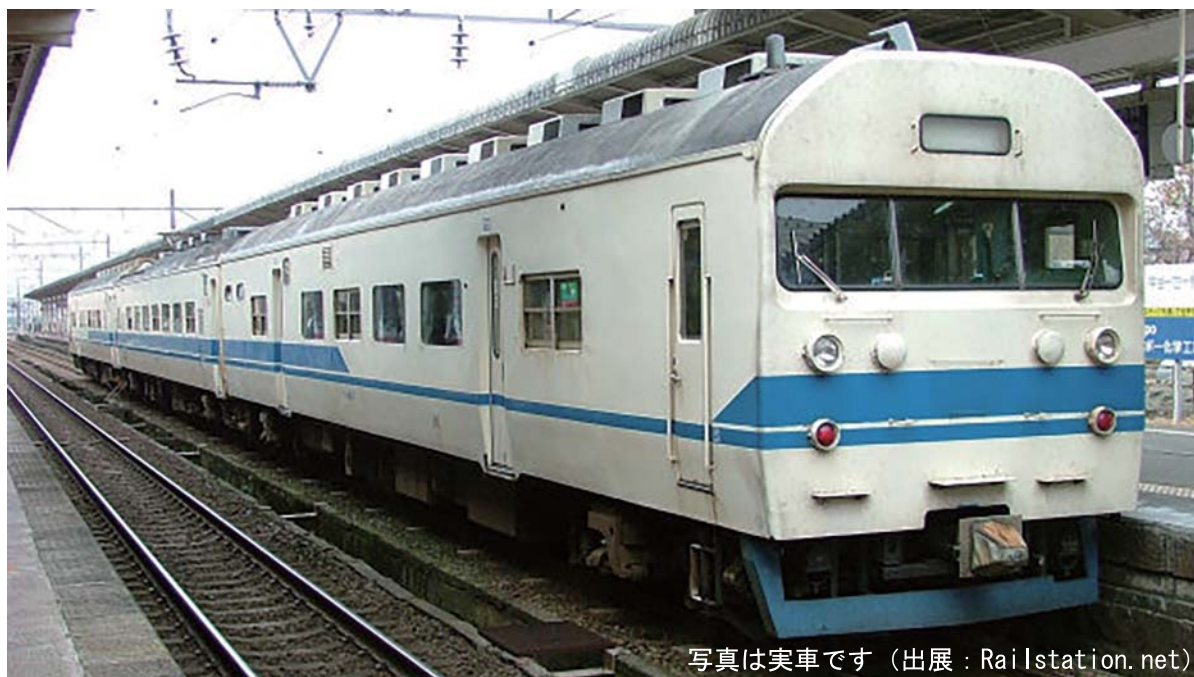
写真は実車です

581・583系電車改造による独特な外観で「ひょうきん電車」・「食パン電車」と親しまれた419系をモデル化します。通常販売品ではいわゆる「片食パン」編成を発売しますが、今回4社合同企画で両切妻運転台のいわゆる「両食パン」編成を発売いたします。塗色は写真の新北陸色となります。